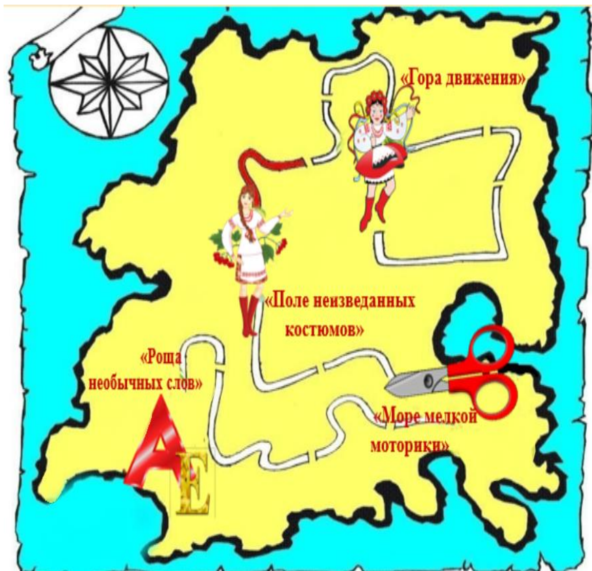
Схема маршрута по стране «Хореография»